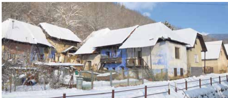
V strede Omastinej sa nachádzajú staré domy v dezolátnom stave, mnohé už len ruiny

Vlčkova, celkom 1019 obyvateľov, čo je o 14 viac ako to bolo pred rokom. Aj tu sa počty zvyšujú vďaka výstavbe rodinných domov. Podľa informácií obecného úradu, v minulom roku tu zomrelo 9 občanov a 10 detí sa narodilo, odšahovalo sa 17 ľudí, ale až 30 sa pristáhovalo. V roku 1828 žilo v Dežericiach 931 obyvateľov, vo Vlčkove 134