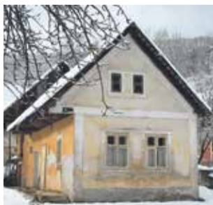
Aj keď Trebichava vymiera, stále sú tu zachované pekné pôvodné staré domy

Na prelome rokov mala obec Držkovce , vrátane