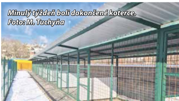
Minulý týždeň boli dokončené koterce.

pamiatok. Takouto je i pamätný dom – súčasnosti budova mestského úradu, v ktorej sme zabezpečili prvú etapu sanácie vlhkosti v hodnote 32 127 eur, z toho 20 000 eur tvorila dotácia z Ministerstva kultúry SR. Oprava historického kameného kríža na cintoríne si vyžiadala prostriedky v sume 8 632 eur.