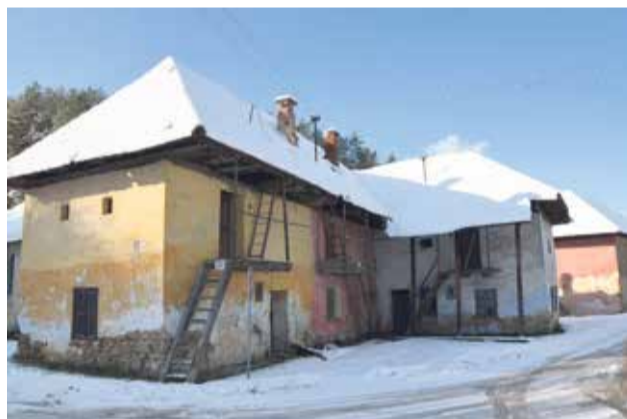
V Uhrovskom Podhradí budí pozornosť tradičná ľudová architektúra, ktorá by si zaslúžila pamiatkarskú ochranu

obyvateľov, v roku 1980 mali Dežerice 707 obyvateľov, vrátane Vlčkova, ktoré sa pripojilo v roku 1964.