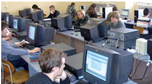
Špeciálne učebne Strednej odbornej školy

Prečo strojárskym podnikom chýbajú kvalifikovaní pracovníci a kam zmizli „veľké priemyslovky“ v našom kraji?