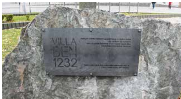
Symbolický základný kameň mesta osadený tesne pred oslavami 785. výročia prvej písomnej zmienky o meste Bánovce (Villa Ben) pod lipou na námestí