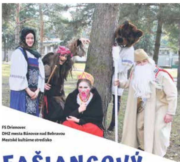
FS Drienovec DHZ mesta Bánovce nad Bebravou Mestské kultúrne stredisko

Nástup možný od 1.3.2020. Žiadosti so štruktúrovaným životopisom zasielajte do 31.01.2020 na adresu: vranka@banovce.sk