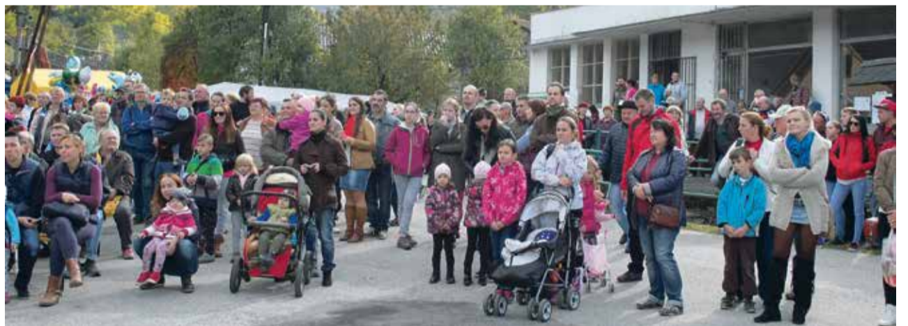
Mnohé slovenské obce dnes vyzerajú lepšie ako pred niekoľkými rokmi. Pribudli čističky, vybudovali sa kanalizácie, zateplili školy či obecné úrady, vynovili námestia. A to všetko aj vďaka financiám z európskych fondov. V novom programovom období (2014 – 2020) je z týchto zdrojov vyčlenených viac financií práve na miestne akčné skupiny (MAS). MAS Strážovské vrchy má sídlo na www.mas-sv.sk . Jednou z akcií pod hlavičkou MAS boli Dni ovocia a medu v Trebichave, ktoré s veľkou obľubou navštevujú Bánovčania (na foto)...

k prepracovaniu pôvodnej a vyhláseniu novej výzvy na udeľovanie štatútov MAS. Zmena sa týkala najmä podmienok pri poskytovaní príspevkov. „Novým nastavením procesu výberu naplníme hlavný cieľ opatrenia, a to väčšie pokrytie územia,“ vysvetlila ministerka pôdohospodárstva a rozvoja vidieka Slovenskej republiky Gabriela Matečná.