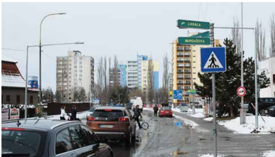
Sládkovičova ulica patrí po Trenčianskej ceste k najfrekventovanejším a nachádza sa tu najviac priechodov pre chodcov. Asi na jednom kilometri je ich desať. Väčšina z nich dostala v rámci modernizácie verejného osvetlenia nové moderné svietidlá... (ab)

MUNSEFF. Doplnili sme celkom 53 svetelných bodov, predovšetkým v mestských častiach a v lokalitách s novou výstavbou rodinných domov v Horných a Dolných Ozorovciach. Osvetlenia sa dočkalo aj priestranstvo za obchodným centrom Stred, športový areál na