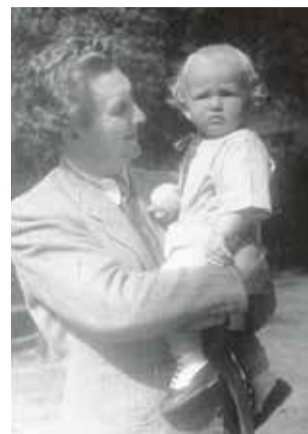
Na snímke so synom Borisom...

V rokoch 1929-1970 vydal 11 publikácií so sociálnou problematikou – prevažne básnických zbierok. Najzaujímavejšími sú Srdce a struny , Odkaz , Lampáš , Stopy a Rozryté jaro . Z próz vyniká Dornkappel – predmestie troch jazykov , týkajúca sa chudobnej bratislavskej štvrti. Počas liečenia v kúpeľoch Trenčianske Teplice (1936) začal písať sociologicky zameranú prácu o blízkej podhorskej dedine Omšenie, ktorú chcel neskôr pod názvom Brázda pod Babou publikovať. Táto práca sa nazýva Pšenáci