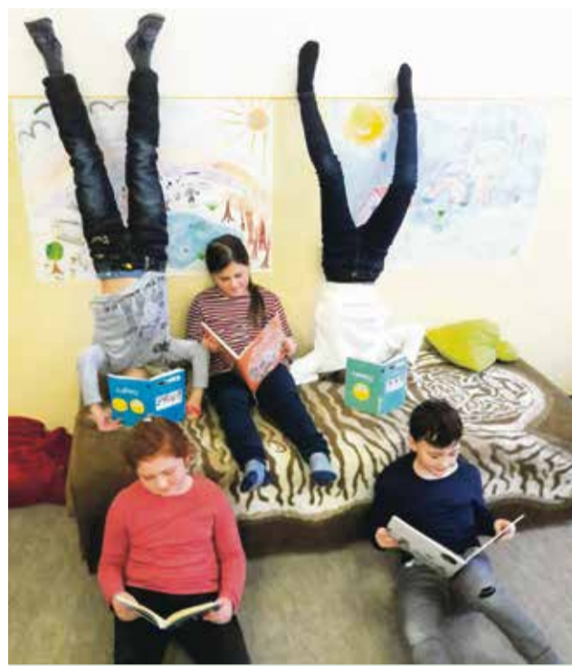
Viac informácií o projekte na stránke https://mamnato.sk/grant/

Cieľom projektu je založenie knižného klubu pre deti a mládež na sídlisku Dubnička. Fyzickou súčasťou projektu bude knižná búdka s oddychovou zónou v exteriérových priestoroch areálu školy, slúžiaca na voľné zapožičiavanie a výmenu kníh všetkým deťom a širokej verejnosti. V interiéri školy vznikne čitateľský kútik s knižnicou, kde sa bude pravidelne raz mesačne stretávať detský knižný klub s príležitostnými tvorivými dielňami či