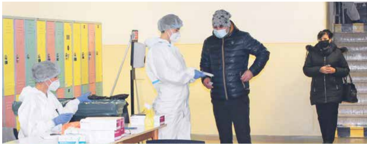
Mobilné odberové miesto - MOM v Strednej odbornej škole strojníckej

Oproti prvému celoplošnému testovaniu na jeseň 2020 sa počet MOM v okrese znížil, nakoľko väčšina obcí prijala návrh okresného úradu o zriadení MOM pre viaceré obce. Ako uviedli niektorí starostovia, bolo to najmä, citujem: „z dôvodu podmienok daných vládny nariadením spojených s náročnosťou na administratívu a finančnú záťaž.“ O vyjadrenie k vytváraniu MOM pre viaceré obce sme požiadali aj niektorých starostov. „Obyvatelia Malých Hostí sa testovali v sobotu v obci Zlatníky. So starostami sme sa dohodli na harmonograme - doobeda sa testovali občania Zlatník, popoludní občania Cimernej a naši občania od 15. do 20. hodiny. Odhadujem, že sa prišlo, tak ako na jeseň, otestovať asi 150 našich občanov. O testovaní našich občanov v Zlatníkoch rozhodol okresný úrad a my sme to prijali. Avšak pri prvom celoplošnom testovaní na jeseň sme mali odberné miesto u nás v kultúrnom dome počas jedného dňa,“ povedala starostka obce Malé Hoste Mar-