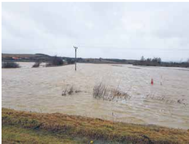
Na projekt varovného a vyzumievacieho systému v meste získalo mesto Bánovce nad Bebravou nenávratný finančný príspevok vo výške 538 586 eur. V rámci projektu pôjde aj o vlastný monitoring ovzdušia, zrážok a stavu vodnej hladiny rieky Bebrava, ktorá sa často vylijeva najmä na poliach medzi Biskupcami a Dvorcom (foto z februára 2020)

• V rámci predloženia projektu - varovný a vyzumievací systém v meste, ktorý je zameraný na vybudovanie komplexného, spoľahlivého a účinného varovného a vyzumievacieho systému, vrátane vlastného monitoringu ovzdušia, na sledovanie zrážok a stavu vodnej hladiny rieky Bebrava a na modernizáciu súčasného rozhlasového systému, sme získali nenávratný finančný príspevok vo výške 538 586 eur. V súčasnosti čakáme na posúdenie verejného obstarávania pred realizáciou projektu.