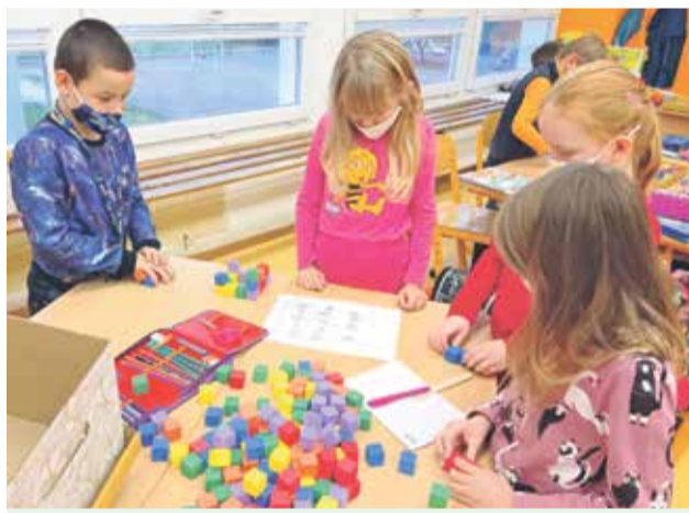
Žiaci Základnej školy Gorazdova

Mesto Bánovce nad Bebravou oznamuje, že v týždni od 25. januára 2021 budú otvorené všetky materské školy na území mesta v obmedzenom režime, a to podľa záujmu detí zákonných zástupcov z kritickej infraštruktúry a pre deti zákonných zástupcov, ktorým povaha práce nedovoľuje pracovať z domu. V prípade akýchkoľvek zmien v prevádzke materských škôl vás budeme včas, na stránke mesta alebo prostredníctvom riaditeľiek materských škôl, informovať.