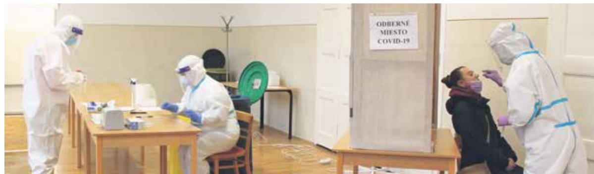
MOM v Kultúrnom dome v Kšínnej