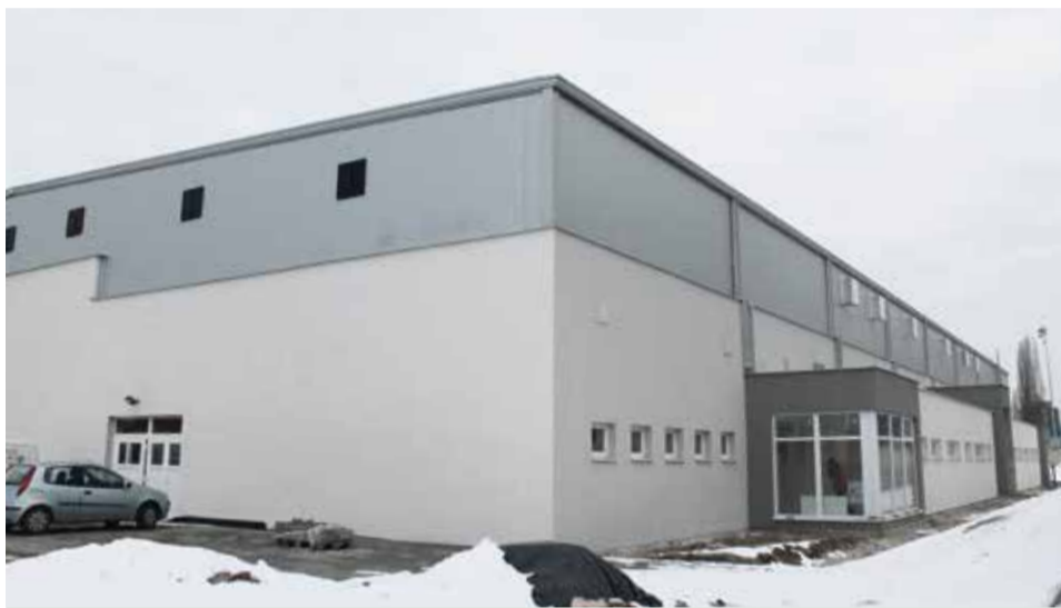
Viac informácií o kolaudácii zimného štadióna na 6. strane...

Bývalý profesionálny hokejista Pavlikovský predstavil koncepciu rozvoja hokeja na krajskej úrovni, v rámci ktorej sa už rozbehli aktivity a projekty, ako napr. Hokejová akadémia či Centrum športovania pri základných školách. Programy sú zamerané na podporu pravidelných tré-