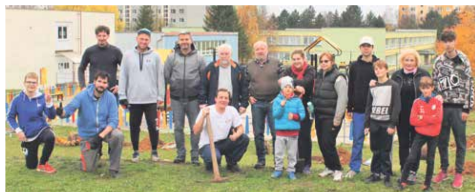
S brigádnikmi na akcii Dni stromov

• Aj v rámci projektu Zlepšenie energetickej hospodárnosti budovy MsÚ sme získali NFP (nenávratný