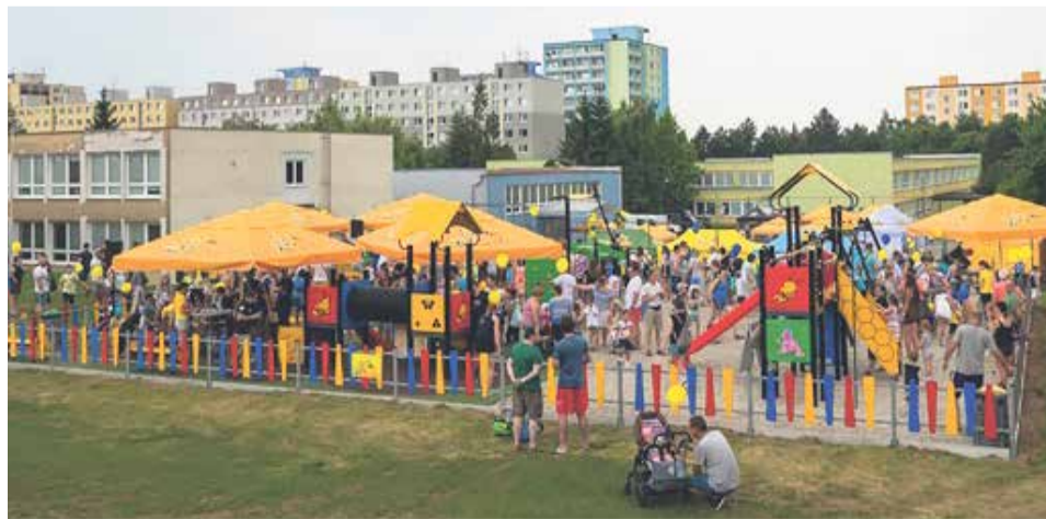
Otvorenie detského ihriska Žihadielko na Dubničke