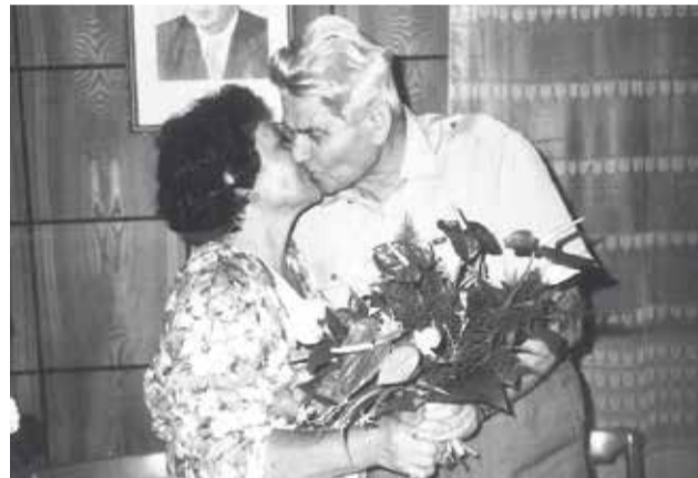
Pri výročí zlatej svadby