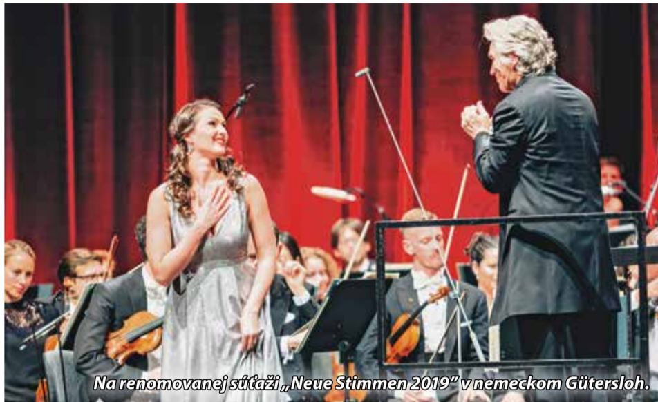
Na renomovanej súťaži „Neue Stimmen 2019“ v nemeckom Güterslohe.

• Čo podľa Vás najviac pomáha vychovať profesionálne speváčky, spevákov?