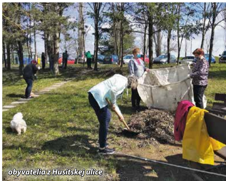
obyvatelia z Husitskej ulice