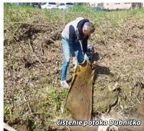
čistenie potoka Dubníčka