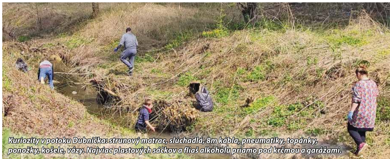
Kuriozity v potoku Dubníčka: strunový matrac, slúchadlá, 8m kábla, pneumatiky, topánky, ponožky, košeľe, vazy. Najviac plastových sáčkov a fliaš alkoholu priamo pod kráľovnou a garážami.