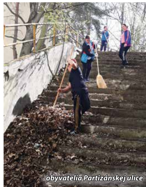
obyvatelia Partizánskej ulice

Jarné susedské upratovanie je skvelá príležitosť na vyčistenie a skrášlenie miest v okolí našich príbytkov, čínziakov alebo v lokalitách, kam radi chodíme. Tento rok prebiehalo 22. - 25. apríla konkrétny dátum a čas si dobrovoľnícke skupinky Bánovčanov vybrali sami. Akciu pripravili viaceré organizácie v spolupráci s mestom Bánovce nad Bebravou pod záštitou OZ BeeN. Dobrovoľníkom dodali rukavice, vrecia a iné pomôcky (dezinfekciu, hrable...) a zabezpečili odvoz odpadu. Projekt Bánovce majú zelenú, v rámci ktorého naplánovali viaceré environmentálne aktivity, podporil Trenčiansky samosprávny kraj z grantu Zelené oči.