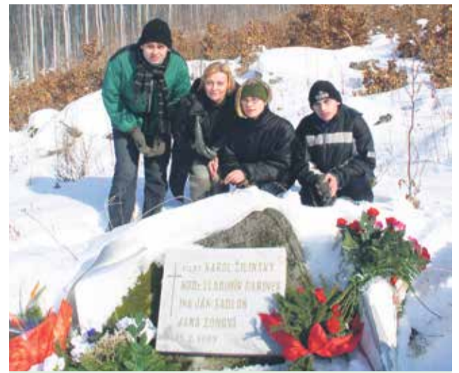
Manželka a deti na mieste havárie v roku 2003