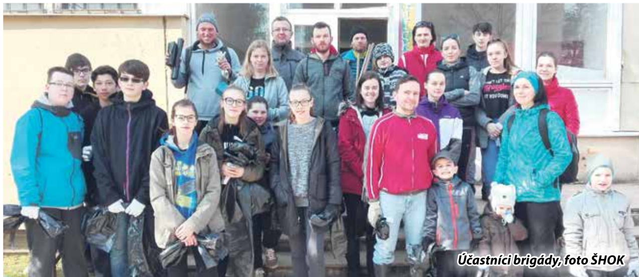
Účastníci brigády, foto ŠHOK