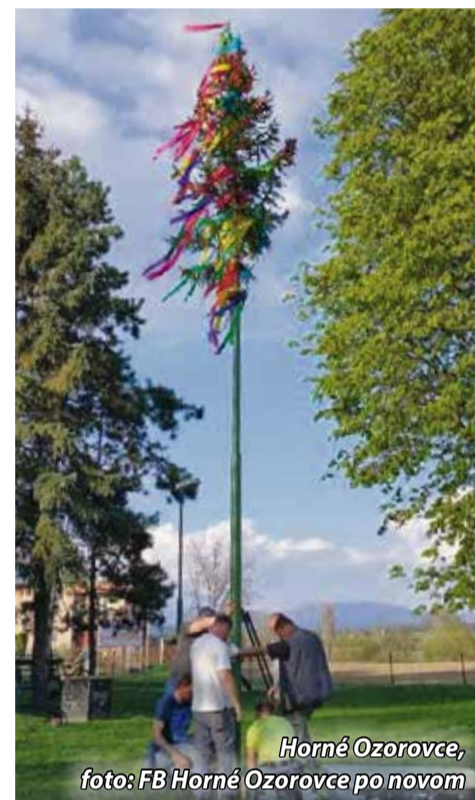
Horné Ozorovce, foto: FB Horné Ozorovce po novom