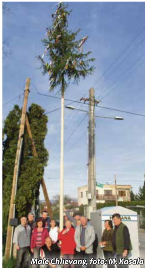
Malé Chlievany

bolo opäť v réžii prítomných mužov. Sviatočnú májovú atmosféru umocňovala reprodukovaná hudba v podobe známych ľudových piesní, pri ktorých bolo niektorým aj do spevu. V Dolných Ozorovciach sa o stavanie májového stromu pričínili taktiež členovia výboru mestskej časti, ako aj dobrovoľného hasičského zboru, ako aj ďalší spoluobčania. I tu vládla príjemná priateľská atmosféra. Je veľmi dobré, že sa na naše tradície nezabúda. A v tejto dobe obzvlášť... (mk)