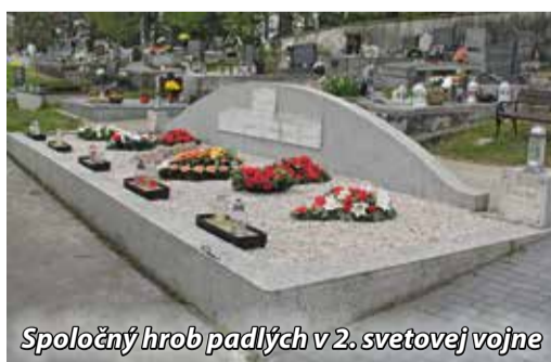
Spoločný hrob padlých v 2. svetovej vojne

Ukončenie druhej svetovej vojny si v Európe, a teda aj u nás na Slovensku, jednotlivé štáty pravidelne pripomínajú 8. mája. Valné zhromaždenie OSN totiž v rezolúcii 59/26 z 22. novembra 2004 vyhlásilo 8. a 9. máj za Dni spomienok a zmierenia na počesť všetkých, čo zomreli v čase druhej svetovej vojny. V bývalom Sovietskom zväze i v terajšej Ruskej federácii ju volajú Velkou vlasteneckou vojnou a Deň víťazstva nad fašizmom oslavujú 9. mája. OSN vyzvala obyvateľov svojich členských štátov, aby si každý rok pripomínali tieto májové dni, jeden