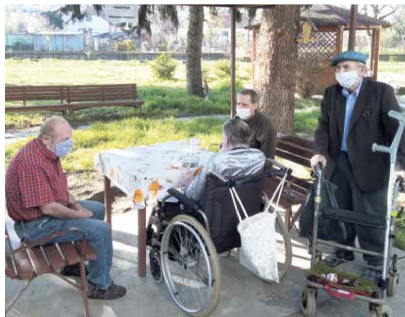
Slnečné jarné dni využívajú klienti CSS na pobyt vonku v malých skupinách

nanci pri nástupe do zamestnania merajú telesnú teplotu, zisťuje sa aj ich prípadná cestovateľská anamnéza a anamnéza rodinných príslušníkov, s ktorými žije v spoločnej domácnosti. Zamestnanci dodržiavajú prijaté hygienické opatrenia - nosia rúška, rukavice, používajú dezinfekčné prostriedky a snažia sa pracovať s klientmi v malých skupinách.