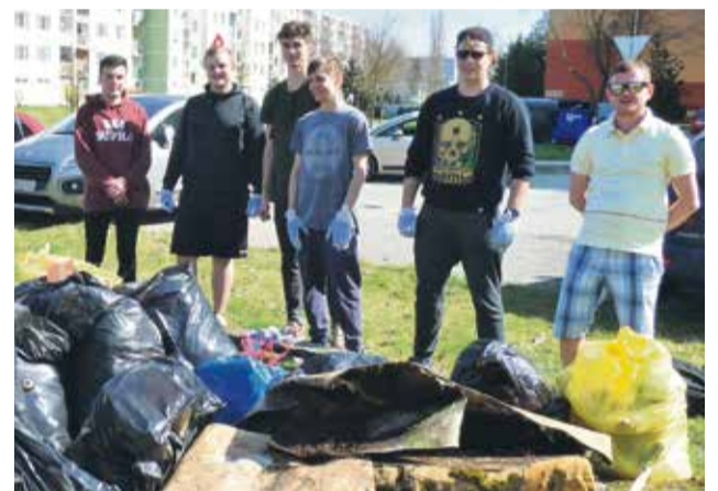
Študenti so SOŠ strojníckej a jeden gymnazista sa pustili do odpadu v okolí panelovej cesty zo sídliska Dubnička smerom k Podlužanom