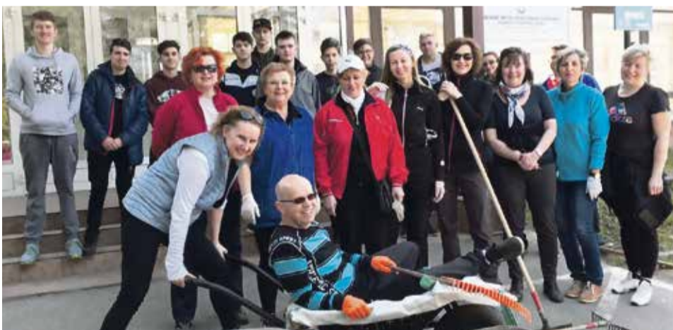
Partia učiteľov, študentov zo SOŠ strojníckej a ďalší dobrovoľníci sa zamerali najmä na okolie školy a Partizánsku ulicu