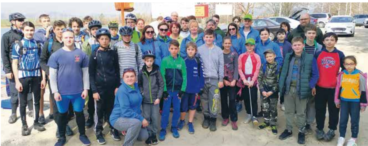
Centrum voľného času, CTK Viking a rybársky krúžok Rybička zbierali odpadky na Pažiti a v okolí vodnej nádrže Prusy