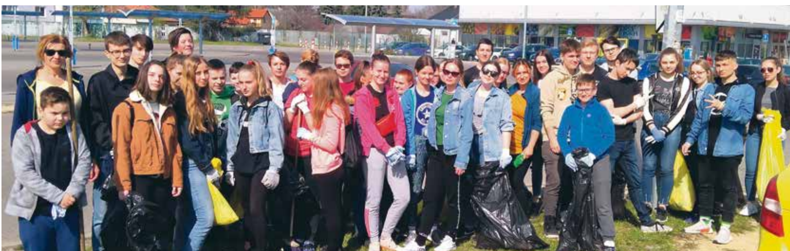
Študenti Gymnázia Janka Jesenského s pani učiteľkami vytvorili skupiny, ktoré upratovali okolie autobusovej stanice a centra mesta, najmä v okolí nemocnice