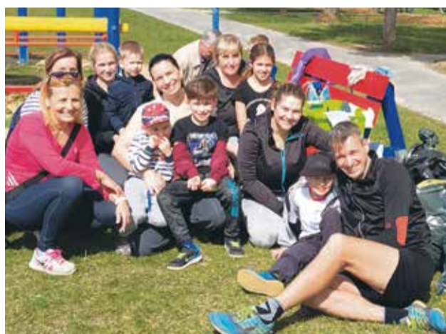
Zapojili sa aj dobrovoľníci zo Žihadielka, ktorí upratovali najmä v okolí detského ihriska na Kukučínovej ulici