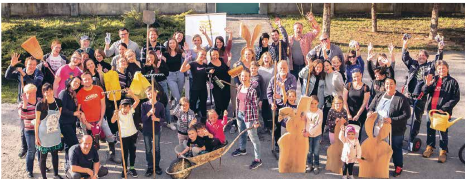
Najväčšia partia dobrovoľníkov – upratovačov k Hodine Zeme sa vytvorila pri ZUŠ D. Kardoša, najskôr krásili okolie školy a potom večer účinkovali pred školou aj na námestí...