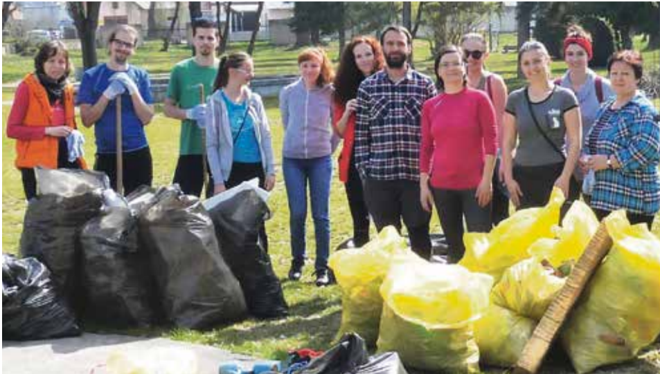
Aktivisti zo Ži:vy a ďalší dobrovoľníci čistili opäť park, najmä však v jeho zadnej časti pri potoku Radiša