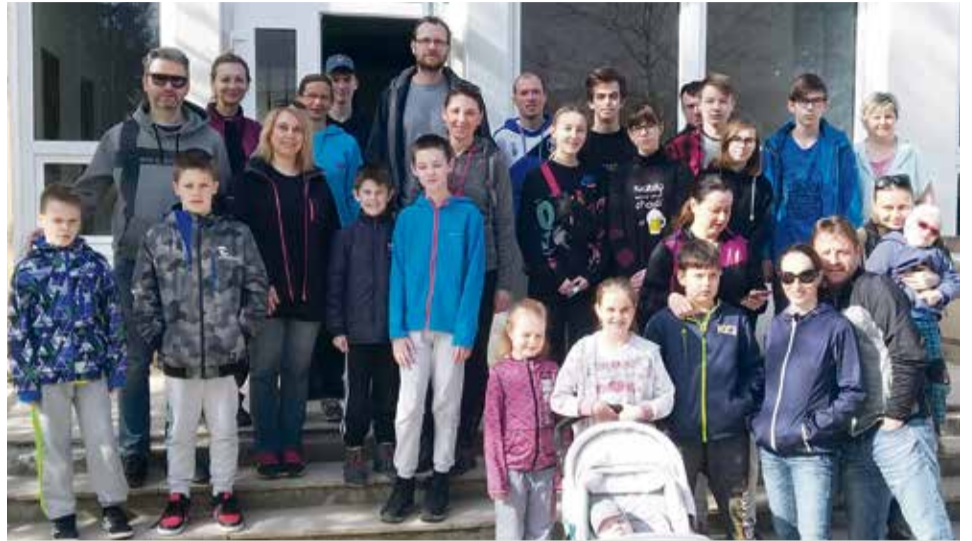
Členovia ŠHOKu – športovo herného a outdoorového klubu so žiakmi zo ZŠ Školská už tradične čistili potok Dubnička na sídlisku