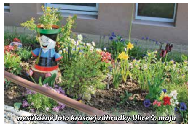
nesŔťažnĔ foto krásnej zĀhradky Ulice 9. mĀja