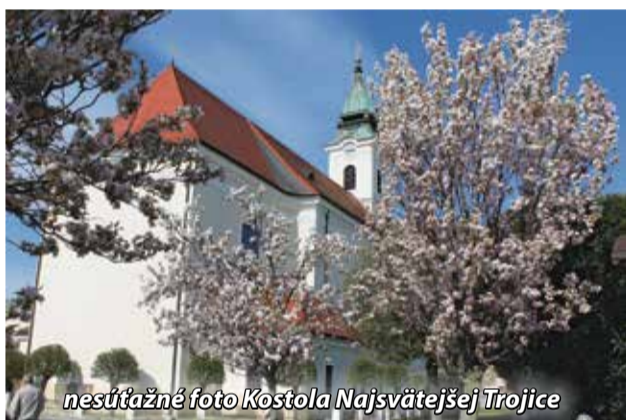
nesŔťažnĔ foto Kostola NajsvĔtejšej Trojice