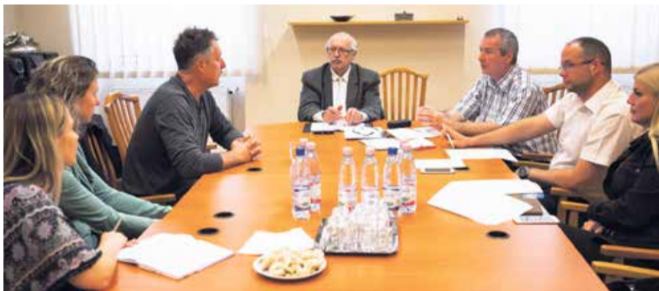
Na rokovaní v Ostrihome s viceprimátorom mesta Lászlóm Bánhidym