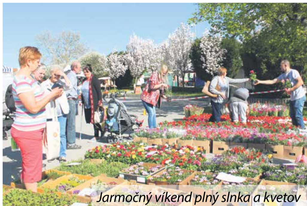
Jarmočný víkend plný slnka a kvetov

Projekt Európa pre občanov čiže Tu žijem! 2018 bude prvý júnový víkend