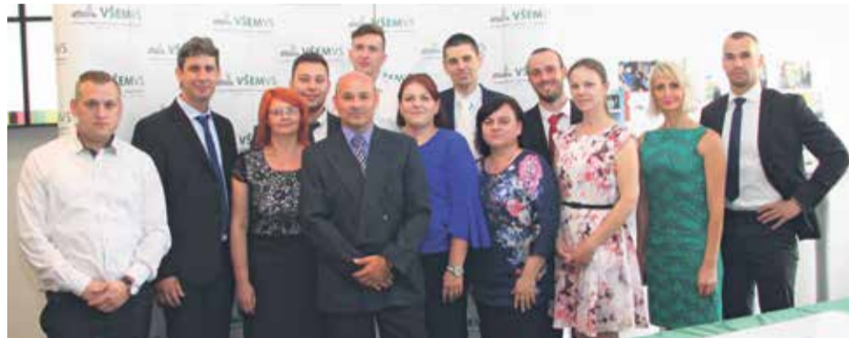
Študenti z MPK Bánovce nad Bebravou na štátnych skúškach

Kontaktu v okresnom meste Bánovce nad Bebravou v spolupráci so samosprávou mesta. VŠEMVVS vytvorila podmienky pre štúdium absolventom stredných škôl nielen z bánovského regiónu, ale aj záujemcom z ďalších okresov, ktorí sú popri zamestnaní