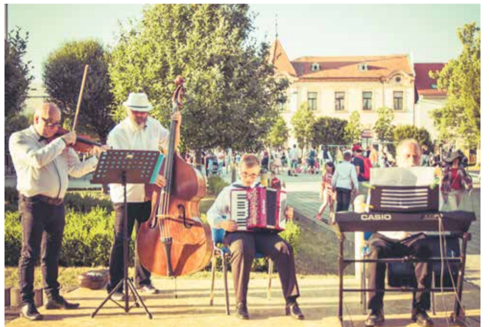
Opäť uvidíme učiteľov hudby a ich žiakov zo ZUŠ DK...