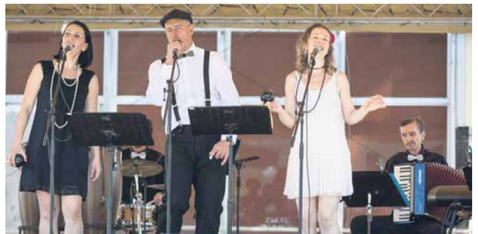
Trojica spevákov s BPHK bandom