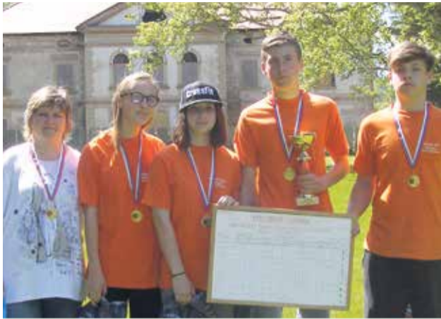
Členovia víťazného družstva zo Základnej školy Školská

z dvoch dievčat a dvoch chlapcov musel absolvovať písomný test zložený z 20 otázok a niekoľko praktických disciplín. V rámci civilnej ochrany obyvateľstva súťažiaci používali ochrannú masku, museli správne určiť improvizované