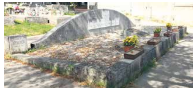
Spoločný hrob na cintoríne niektorých zo zavraždených