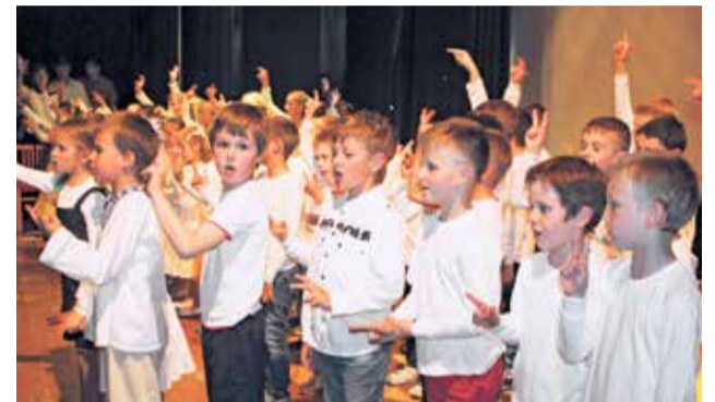
Prváci počas slávnostnej akadémie

krúžkoch, písať príspevky do školského časopisu, rozvíjať svoju osobnosť v školskom parlamente, či ukázať sa v školskej televízii. Škola je každoročne organizátorom okresných kôl v matematickej olympiáde a Pytagoriáde. Žiaci dosahujú mimoriadne úspechy