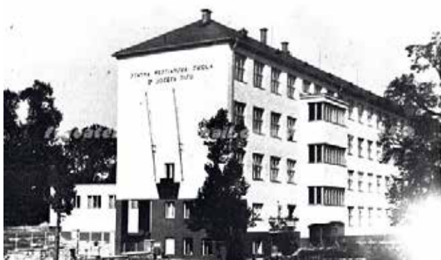
Novopostavená škola v roku 1942

Povojnové časy neboli pre fungovanie školy ľahké. Múry školy môžu aj dnes o nich rozprávať. Ich rekonštrukcia trvala celý rok po vojne. V rokoch 1948-49 ju navštevovalo až 828 žiakov, čo je najväčší počet v jej his-