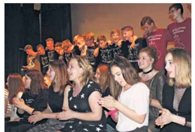
Terajší deviataci pri rozlúčke so školou