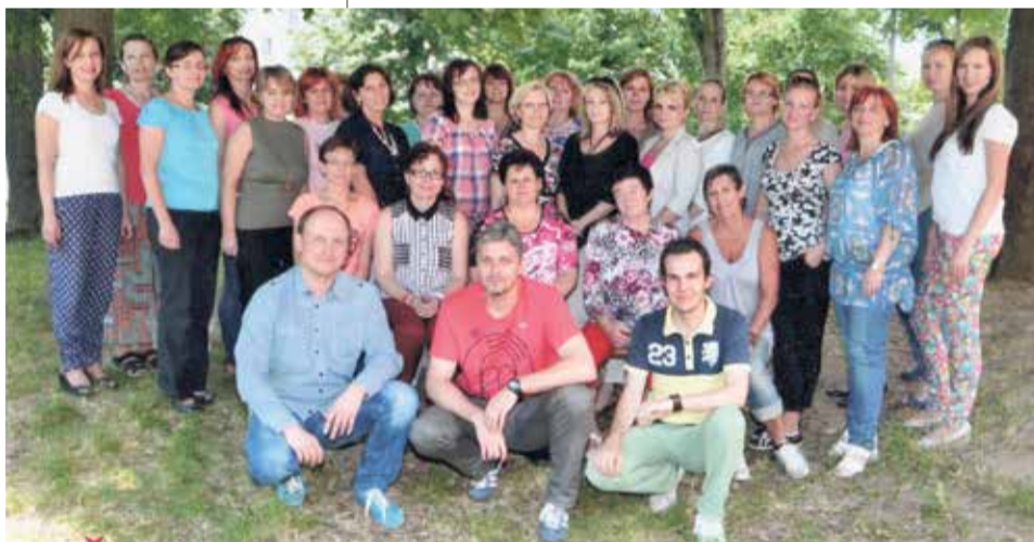
Súčasní zamestnanci školy