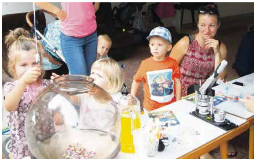
Od 16. hodiny sú v obývačke pripravené hry pre deti