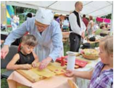
Ako pracovať so včelím voskom, napríklad pri výrobe sviečok, si mohli vyskúšať aj deti. To by však už nezvládli pri výrobe huslí, ktorú tu prezentoval ďalší remeselník...