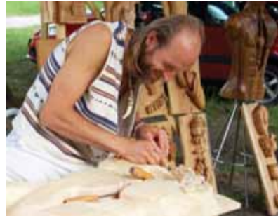
Tradičné remeslo drevorezárstvo môže mať rôzne podoby aj na Morave, náš región sa predstavil výrobkami z hliny a ručne vyrobenou bižutiou, nechýbala ani paličková čipka