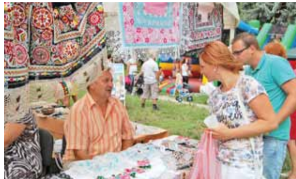
Slovácky kraj je špecifický bohatosťou ručne vyšívaných vzorov. Je obdivuhodné, že tradícia vyšívania tu žije dodnes a vzťah k nemu majú aj muži...