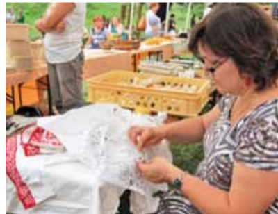
Precíznu robotu pri vyšívaní pánskych rukávčov sme mohli vidieť na vlastné oči, a takú istú presnú ruku musela mať cukrárka pri zdobení perníkov