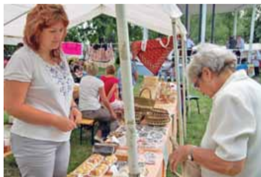
A aké by to bolo podujatie bez kvalitného občerstvenia? Okrem iného hostia ponúkali tradičné koláče, perníky i zemiakové lokše (na Morave ich nájdete pod úplne iným názvom), ktoré vraj pre Bánovčanov chystali od skorého rána, len aby boli čerstvé... A boli...