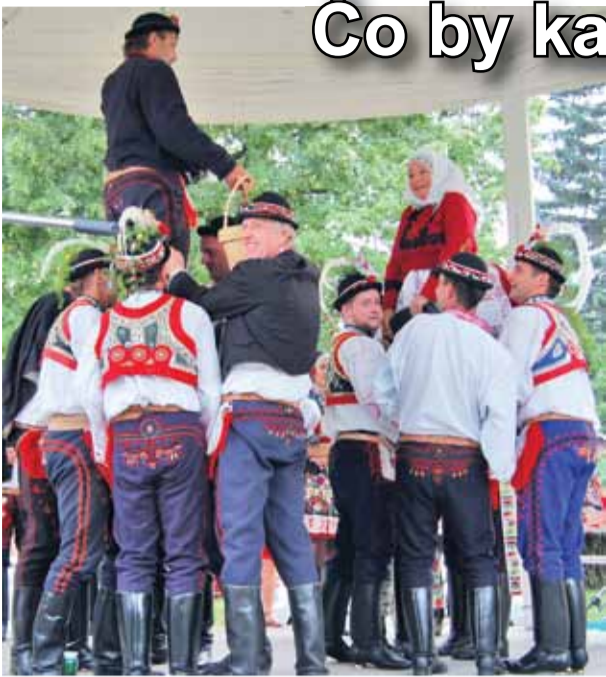
Jeden z najobľúbenejších ľudových zvykov sú v Miloticiach hody. Gazdu a gazdinú mladenci dvíhali na stoličkách ako podakovanie, že im dovolili hodovú zábavu...