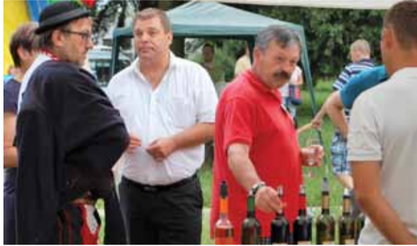
O kvalitných juhomoravských vínach ide dobrý chýr. Spoločnú koštovku si neodpustili ani bánovský primátor a milotický starosta v kroji, ktorý je členom folklórneho súboru