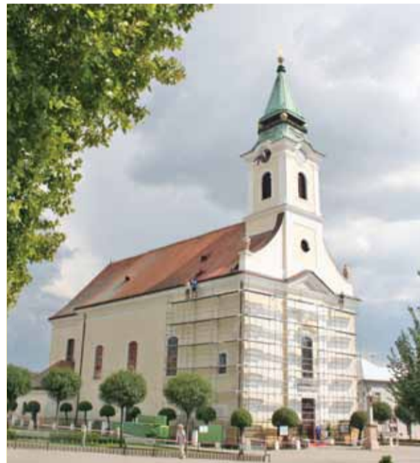
Kostol Najsvätejšej Trojice sa oblieka do nového šatu. Náš fotoaparát bol pri tom, keď sa mu menili hodiny, lepšie povedané ciferník. Obnova tejto dominanty bánovského námestia prinesie väčší zážitok aj pre návštevníkov mesta. Viac o rekonštrukcii kostola v budúcom vydaní novin...

vania o vecné ceny. Prvým záhytným bodom sú informačné tabule ako sa dostať k informáciám mesta. Pravidelne ich treba aktualizovať a doplniť hlavne na veľkých sídliskách, kde sa nachádza najviac obyvateľov mesta. Tým zabezpečíme ešte väčšiu informovanosť. Ako pozitívum vidím vytvorenie informačného centra na Námestí L. Štúra, ktoré podáva informá-