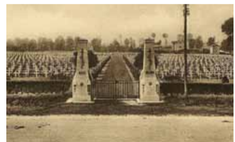
Francúzsky vojenský cintorín z prvej svetovej vojny v Brase blízko Verdunu