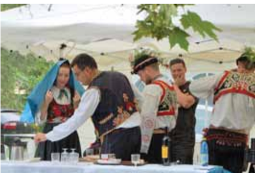
Dobre pripravený program v rámci Kultúrneho leta, pod ktorý sa podpísalo Mestské kultúrne stredisko, prerušil a skrátil výdatný lejak. Účinkujúci si predovšetkým chránili kroje a nástroje... Spoločne s naším Drienovcom sa stretnú v nedeľu 10. augusta na festivale v Miloticiach