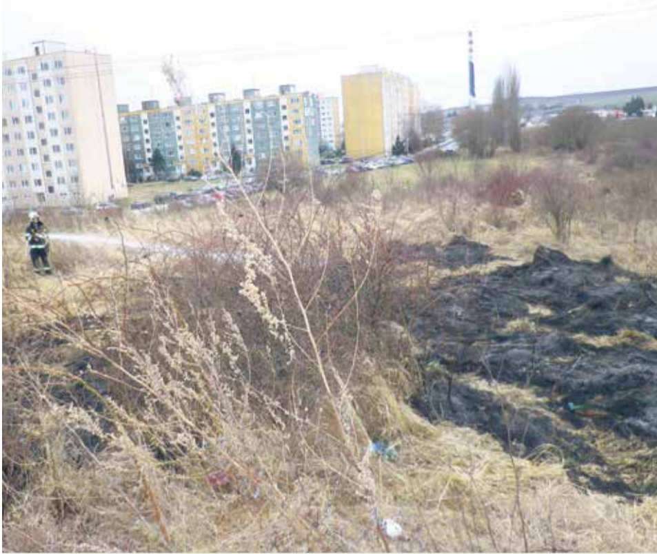
Požiar porastu pri sídlisku Dubnička