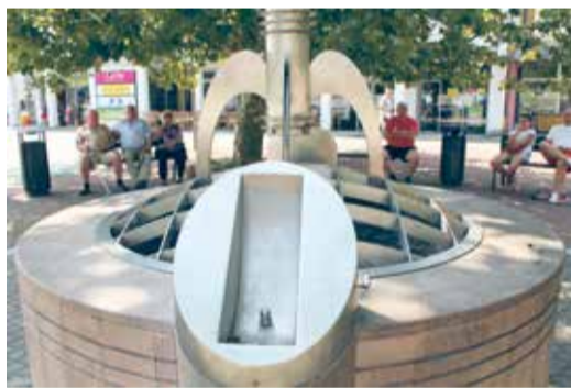
Pitnú vodu nájdete aj vo fontánke na pitie umiestnenej na „studni lásky“ pred okresným úradom na námestí

Hasičský a záchranný zbor v Bánovciach nad Bebravou vyhlásil čas zvýšeného nebezpečenstva požiarov