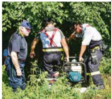
Protipovodňové bariéry boli plnené pomocou kalových alebo plávajúcich čerpadiel vodou z rieky Bebrava