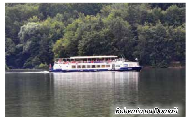
Bohemia na Domaši