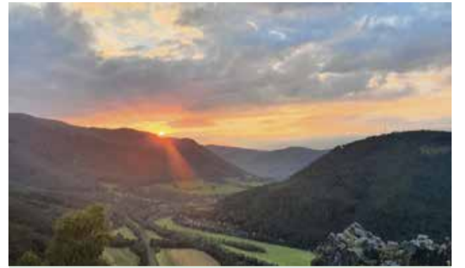
Na Jánošíkovej bašte nad obcou Kysak

Nepovedal by som o sebe, že som vášnivý tu-