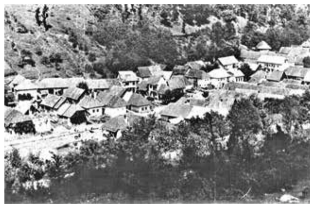
Omastiná po skončení druhej svetovej vojny...

partizáni z majerov v Ostratiaciach, Rybanoch, Borčanoch aj v Dolných Našticiach pre partizánsky bitúnok, ktorý bol zriadený v omastinskom chotári v Lámanom údole. Na zaoštarávaní potrebného