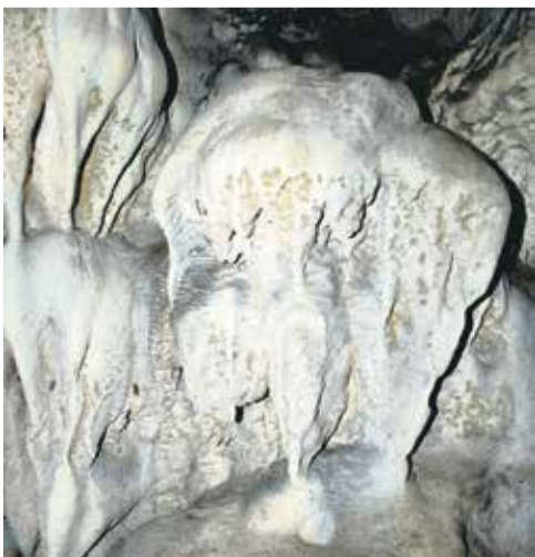
Vstup do Čerešňovej jaskyne, voľne prístupnej, je problematický