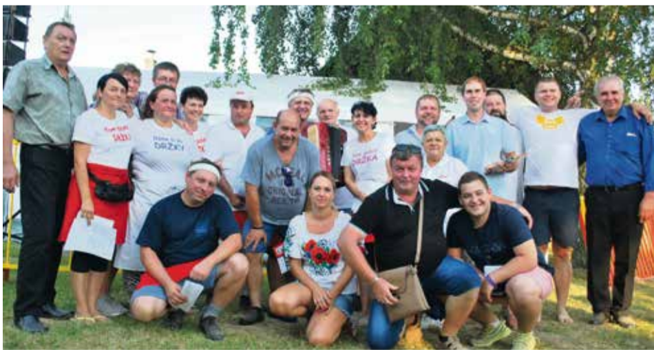
Na foto členovia občianskeho združenia Hodoču, ktorí podujatie organizovali