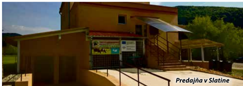
Predajňa v Slatine

hospodáriť na ploche 113 hektárov. V súčasnosti má podnik 39 zamestnancov a obhospodaruje plochu asi 750 ha, z čoho 170 ha tvorí orná pôda a 580 ha trvalé travné porasty. Podhorské prostredie svojim zložením