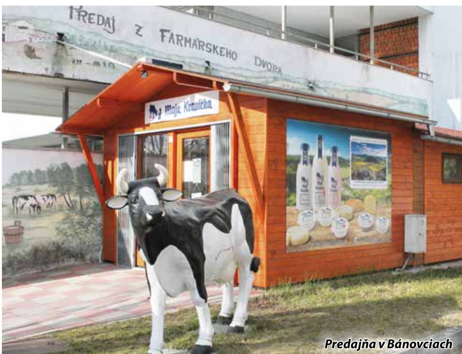
Predajňa v Bánovciach

Momentálne zásobujeme približne 100 predajných miest, vrátane dvoch vlastných podnikových predajní, čo svedčí o obľúbenosti a kvalite mliečnych výrobkov pochádzajúcich priamo z nášho družstva. (PD Slatina)