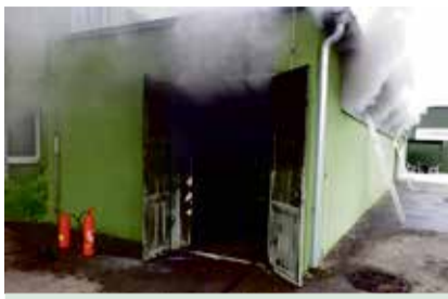
Požiar vo firme Kord