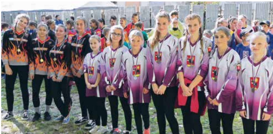
Vľavo zlaté Dolnoozorovčanky, druhé a tretie Žitnianky-Radišanky

Snečná sobota 6. októbra bola predpokladom úspešnej akcie pre mladých hasičov v okrese Bánovce nad Bebravou. V parku pri kaštieli v obci Šišov sa zišlo 21 štvorčlenných kolektívov, ale i hosťujúce družstvá z Radošiny. Všetci si zasúťažili vo vytrvalosti na viac ako kilometrovej trati, ako i v ôsmich technických disciplínach. Preliezali dvojmetrovú rebríkovú bariéru, zhadzovali terče pomocou ručných džberových striekačiek a D prudničiek. Rozhodnutím dvojito zvinutej hadice C zhadzovali kužele. Strielali zo vzduchovky. Preliezali cez improvizovaný potok rúčkovaním po lane, prekonávali dvojmetrový tunel a následne poklusom cez 10 pneumatík. Nechýbala ani disciplína viazania uzlov, či určovania technických