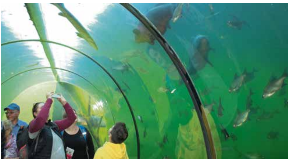
Viac foto nájdú bánovskí účastníci zájazdu na facebooku KST Kamarát

Svet pod hladinou rybníka nás uchvátil. A v ňom najväčšie sladkovodné ryby a medzi nimi kráľovná našich vôd - vyza veľká, sumce, korytnačky... S nadšením 25 detí a 27 rodičov, resp. starých rodičov absolvovalo návštevu sladkovodnej a botanickej expozície Živá voda v moravskej obci Modrá. Objekt vybudovaný v roku 2012 z eurofondov v rámci cezhraničnej spolupráce s obcou Uhrovec ponúka okrem tohto zaujímavého vodného sveta v priamom prenose až v šesťmetrovej hĺbke aj množstvo vzdelávania a zábavy s environmentálnou témou. Všetci sa prešli po botanickom chodníku s bylinami a drevinami, ktoré rastú okolo vód, „ohmatali“ hmatovú výstavu makiet rýb a vyskúšali ďalšie multimedialne aktivity. Najnovšou