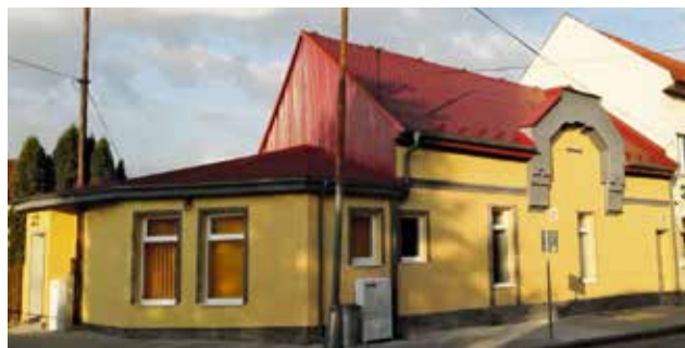
Nová modlitebňa na Ulici SNP

V decembri plánujeme urobiť biblické prednášky pre verejnosť. Od januára chceme organizovať pravidelné stretnutia v piatok večer, taktiež pre verejnosť, kde budeme študovať jednu z biblických kníh. Okrem toho chceme od jari organizovať kluby zdravia v spolupráci s občianskym združením Život a zdravie, s ktorým máme veľmi dobré vzťahy. Takéto kluby máme už v Prievidzi a Topoľčanoch. Ako cirkev veríme, že sme chrámom Ducha svätého, preto Pánu Bohu záleží, nielen na našom duševnom zdraví, ale aj na tom fyzickom. Budú to vegetariánske kluby, kde budeme hovoriť o zdravej výžive, striedmosti a dokonca budú aj kurzy zdravého varenia.