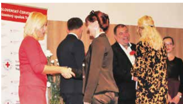
Zástupcovia mesta blahoželajú oceneným...

Potreba krvi je stále veľká. Podľa informácií Národnej transfúznej služby SR sa každoročne spotrebuje iba na Slovensku približne 180 000 transfúzných jednotiek červených krviniek. Darovaná krv je spracovávaná na jednotlivé zložky, napríklad červené krvinky zachraňujú životy pacientov počas operácií a po úrazoch. Plazma je určená pre pacientov trpiacich poruchami zrážania krvi a tretia zložka, krvné doštičky, zastavuje krvácanie a často sa podáva pacientom liečiacich sa na nádorové ochorenia