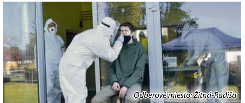
Odberové miesto: Žitná-Radiša

V Horných Našticiach sa testovalo len jeden deň. V sobotu 30. októbra sa síce tvorili rady, ale nasledujúca sobota bola už len s minimálnym čakaním. „ V našej obci prebehlo prvé kolo testovania k plnej spokojnosti jak testovaných tak aj zdravotníkov a ostatného personálu. V priebehu celého dňa sa nevyskytli žiadne problémy. Obec zabezpečila dobrovoľníkov, poslan-