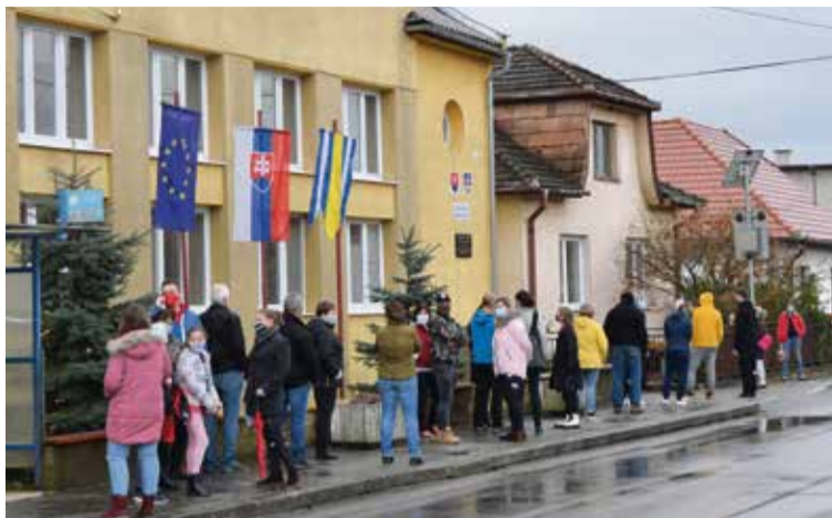
V Horných Našticiach sa 31. októbra tvoril dlhší rad (na foto), druhá odberová sobota už bola s minimálnym čakaním