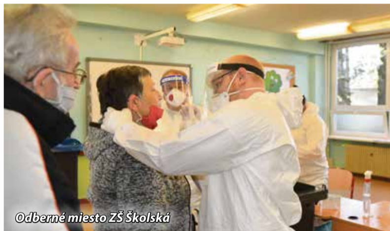
Odborné miesto ZŠ Školská