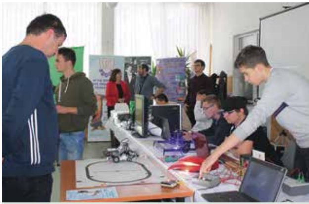
Prezentácia SOŠ strojníckej

Gymnázium Janka Jesenského pripravuje mládež predovšetkým pre vysokoškolské štúdium rôznych odborov. Absolventi sa uplatnili v rôznych umeleckých, informačných, pedagogických, economic-