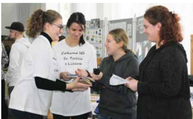
Študentky Cirkevnej strednej školy pri rozdávaní školských propagačných materiálov

Stredná odborná škola strojnícka ponúka študijné i učebné odbory. Vo štvorročných študijných odboroch s maturitou môžu absolventi základnej školy študovať strojárstvo, mechatroniku, elektrotech-