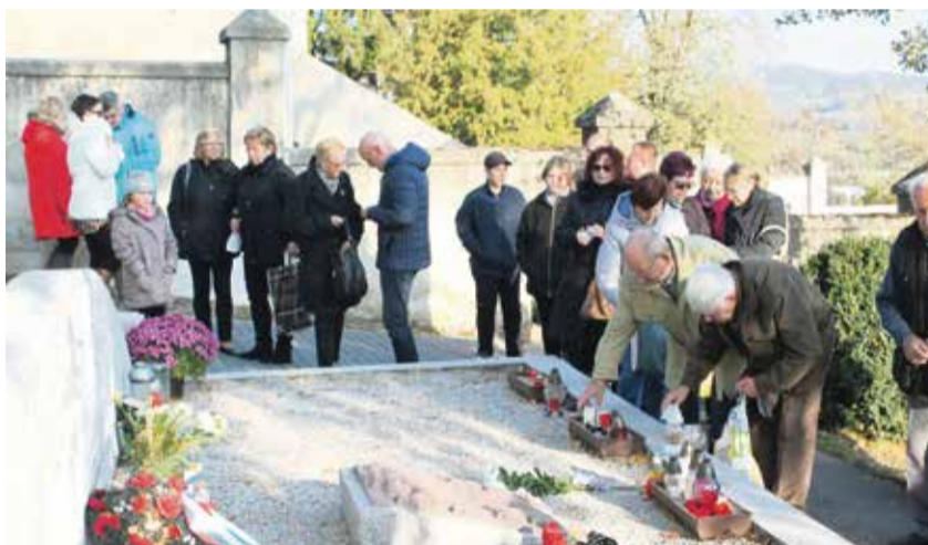
Pri spoločnom hrobe neznámych partizánov

organizácie Slovenského zväzu protifašistických bojovníkov. Nad urnovým hájom plápolal „večný“ oheň, ku ktorému položili kvety a zapálili sviece.