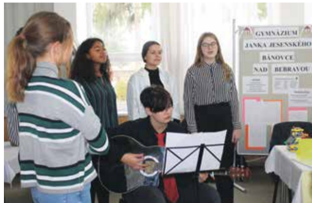
Gymnázium obohatilo burzu aj spevácko-hudobným vystúpením

Cirkevná stredná škola sv. Terézie z Lisieux otvorila svoje brány v školskom roku 2019/2020 v priestoroch bývalej „priemyslovky“ na Farskej ulici. Ponúka štvorročné študijné odbory s maturitou: výchovno - opatrovateľská činnosť, operátor - operátorka odevnej výroby (v rámci duálneho vzdelávania),