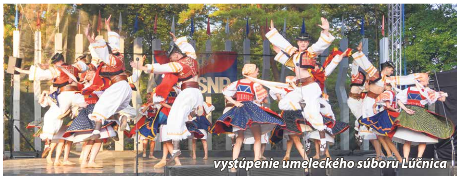
vystúpenie umeleckého súboru Lúčnica

Po odovzdaní ocenení pokračoval kultúrny program vystúpením umeleckého súboru Lúčnica, ktorý si pripravil pestrý program prezentujúci tance a kroje všetkých regiónov