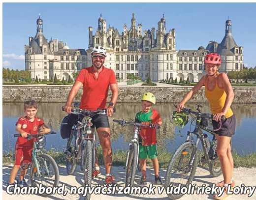
Chambord, najväčší zámok v údolí rieky Loire

Prechádzali sme cez sedem krajín, no dlhšie prestávky sme mali iba v Nemecku a Francúzsku. Najviac sme boli očarení z juhu Nemecka, v Bavorsku, kde sme boli nadšení krásnymi