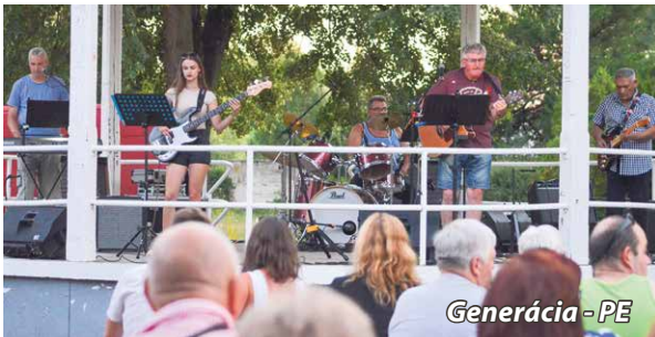
Generácia - PE