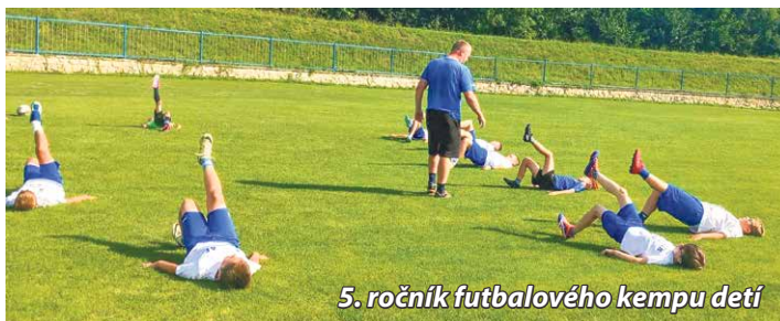
5. ročník futbalového kempu detí

Čo sa týka športovej stránky, o mládež zastúpenú všetkými kategóriami, t. j. od prípraviek, cez žiakov až po dorast sa stará 14 kvalifikovaných trénerov. Tí pokračujú v nastavenej filozofii klubu, ktorá prináša aj svoje ovocie.