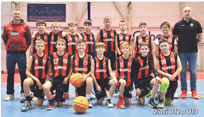
žiaci U12 a U13