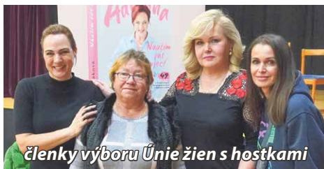
Členky výboru Únie žien s hostkami