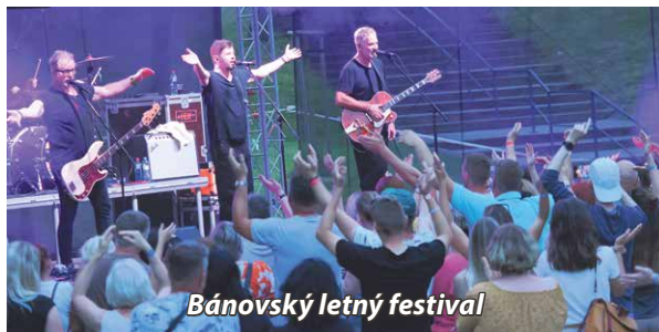
Bánovský letný festival

Vďaka pestrému programu sa do bánovského kultúrneho stánku prichádzali pozrieť nielen miestni, ale aj obyvatelia okolitých obcí, ktorí si chceli dopriať kvalitný kultúrny zážitok. To však nebolo všetko! Doslova hitom sa stali divadelné predstavenia a vystúpenia pre deti ako Ladové kráľovstvo , Smejko a Tanculienka či Telka strýka Baltazára . Najmladší diváci sa veľmi tešili a užívali si ich veselé príhody. No bavili sa nielen deti – rodičia, ktorí prišli so svojimi ratolesťami, si často odnášali zaujímavejšie zážitky ako ich deti. Keď sa v divadelnej sále ozýval smiech z každej strany, bolo jasné, že práve tu sa vytvárajú nezabudnuteľné spomienky.