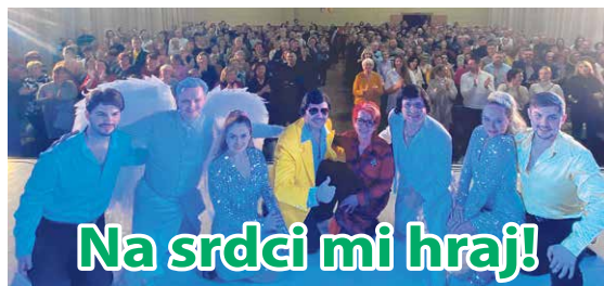
Na srdci mi hraji!

nie ponúklo nielen hudbu, ale aj bohatý vizuálny a emocionálny zážitok. O výnimočný charakter večera sa postarali