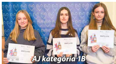
AJ kategória 1B