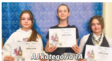
AJ kategória 1A