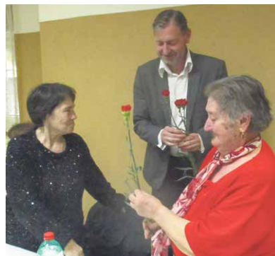
Všetci prítomní sa zhodli, že toto podujatie sa opäť vydarilo.