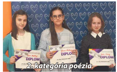
2. kategória poézia

V bánovskom Centre voľného času sa v utorok 18. marca uskutočnil 71. ročník okresného kola prednesu poézie a prózy Hviezdoslavov Kubína. Je najstaršou a najprestížnejšou súťažou v umeleckom prednese a vrcholným podujatím, ktoré vytvára a formuje kultúru slovenského národa. Okresného kola sa zúčastnilo 54 detí zo základných škôl okresu.