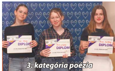
3. kategória poézia