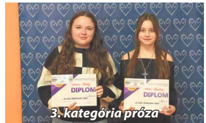
3. kategória próza