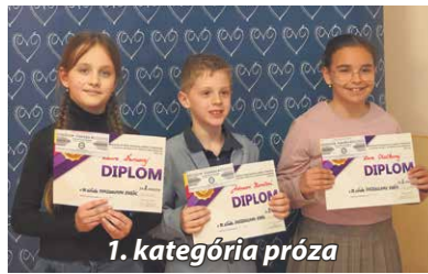
1. kategória próza