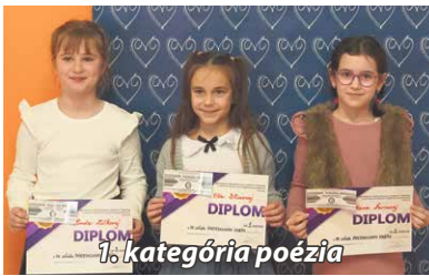
0. kategória poézia