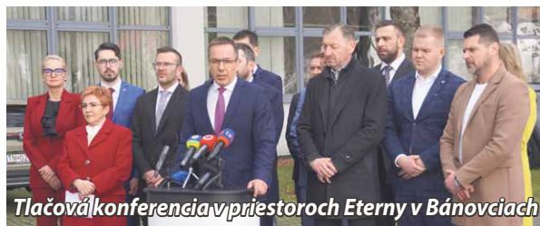
Tlačová konferencia v priestoroch Eterny v Bánovciach

dostanú svoje peniaze prostredníctvom garančného fondu zo Sociálnej poisťovne. Tento krok je zásadný pre zmiernenie sociálnych dopadov, ktoré vznikli po ukončení činnosti spoločnosti a v ktorých sa ocitli stovky žien – často jediných žiteľov rodiny. Primátor v mene vedenia mesta poďakoval ministromi práce, ako aj