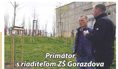
Primátor s riaditeľom ZŠ Gorazdova

sami, pričom každý strom má svoje vlastné číslo. Zapojiť sa môžu aj obyvatelia mesta – v rámci pripravovanej kampane si môžu „adoptovať“ strom a pomôcť s jeho starostlivosťou. O zálievku sa postará škola. S myšlienkou projektu prišiel riaditeľ školy, ktorý sa teší z úspešnej realizácie. K iniciatíve sa s nad-