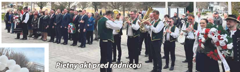
Pietny akt pred radnicou

1. armády v zostave sovietskej 53. armády, ktorí v ranných hodinách vstúpili do Bánoviec nad Bebravou, no mnohí z nich sa domov už nikdy nevrátili.