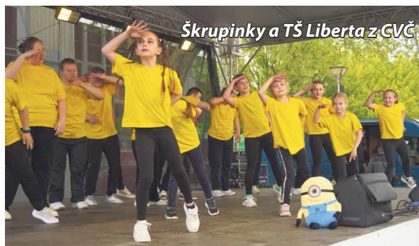
Škrupinky a TŠ Liberta z CVC

sa návštevníci mohli pokochať výhľadom na Bánovce. Jarmočná sobota už prebiehala v tichšom duchu. Vzhľadom