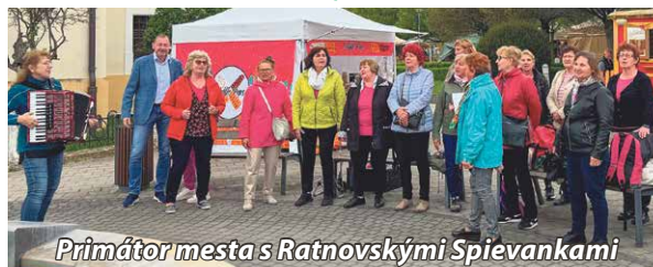
Prímátor mesta s Ratnovskými Spievankami

na vyhlásený štátny smútok za zosnulého pápeža Františka bol kultúrny program a hudobná produkcia zrušená.