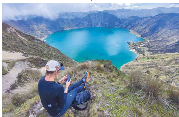
kráter sopky Quilotoa s jazerom v Ekvádore