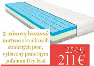
5-zónový luxusný matrac z kvalitných studených pien, vybavený prateľným potahom Dry Fast