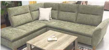
Sedacia súprava s rozkladom