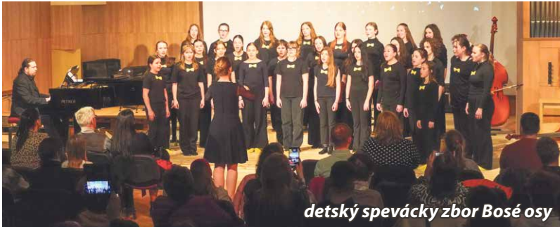
det'ský spevácky zbor Bosé osy