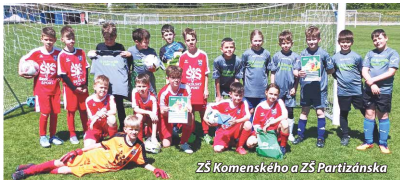
ZŠ Komenského a ZŠ Partizánska

štvrtok 30. apríla organizátorom okresného kola McDonald`s Cup v minifutbale žiakov a žiačok I. stupňa ZŠ, ktoré sa odohralo na hlavnom ihrisku s prírodnou trávou na MFC Spartak.